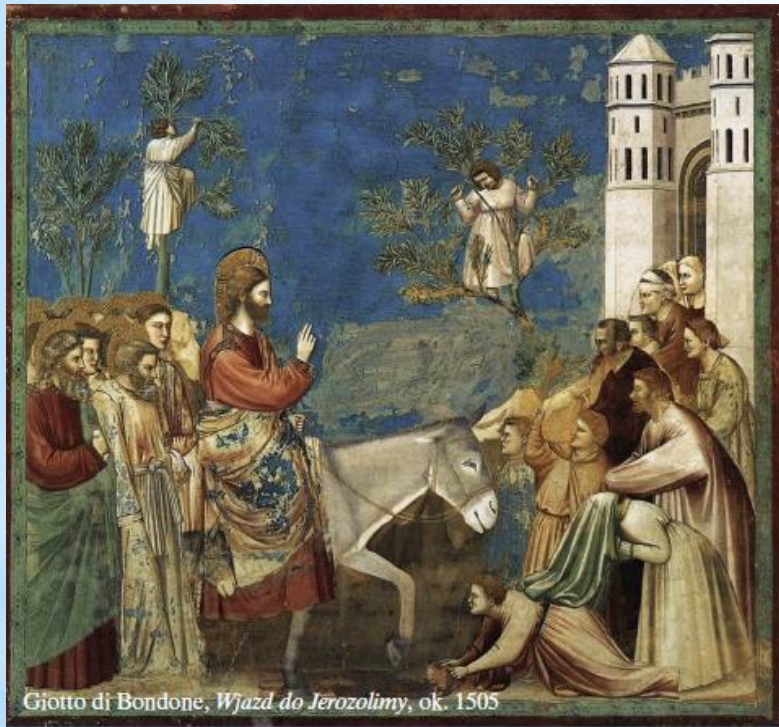
Giotto di Bondone, Wjazd do Jerozolimy, ok. 1305

Tak, Wielkanoc to niezwykle trudne do pojęcia święto, a może owa trudność ma nam pomóc, ułatwić oddzielenie doczesnego od wiecznego, tego co jest ważne, a co nie... Wskazywać drogi do zbawienia.