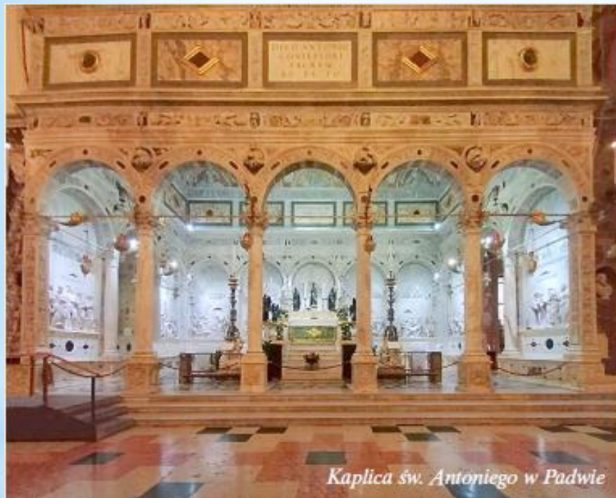
Kaplica św. Antoniego w Padwie

Ale przecież myśl nie utrudzona zmęczeniem jest znacznie lżejsza i jaśniejsza; czynimy to właśnie w takiej nadziei. Wędrując po corocznych wydarzeniach z kalendarza Kościoła zachowując ich religijny wymiar i należną cześć, niejako równocześnie zapraszamy na spacer po różnych miejscach na Ziemi (dla jednych faktyczny, związany z wakacyjnymi wyjazdami, dla innych tylko wirtualny), w którym „przy okazji”, podczas zwiedzania ciekawych miejsc możemy spotkać Stwórcę.