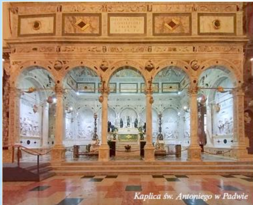
Kaplica św. Antoniego w Padwie

Nie podejmując rozstrzygnięcia, co ważniejsze, nawet by nie przystało, i nie zważając zbytnio na chronologię przywołanych wydarzeń, w kilku tekstach oraz ilustracjach będziemy odwoływać się do tych tematów, by jeszcze bardziej utrwaliły się w naszej pamięci, zwłaszcza w sferze przesłania, które te święta niosą, choć przed nami niedługo czas letni, bardziej niż na fraszunek nastawiony na wypoczynek.