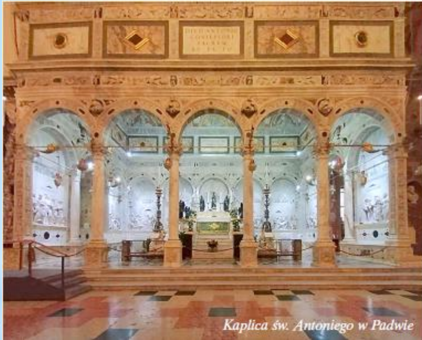
Kaplica św. Antoniego w Padwie

Od czego by tu zacząć, na czym się skoncentrować: w czerwcu, co z Bożym Ciałem i świętem naszego patrona, św. Antoniego z Padwy, w miesiącu który po maju, z nabożeństwami Maryjnymi, a wkrótce, w porze kanikuły – uroczystością Matki Bożej Zielnej.