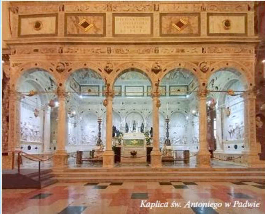
Kaplica św. Antoniego w Padwie

Za chwilę, 13 czerwca – święto Patrona. Można by zażartować: ale potem wakacje, będzie można odpocząć. No właśnie, czy od Boga też? Życząc wszystkim udanego, letniego wypoczynku, zostawiam każdego z Wiernych z tym pytaniem, i przekonaniem, że Stwórca nie ma zamiaru od nas odpocząć.